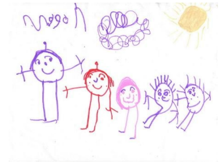
la escritura writing