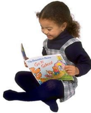
la lectura reading