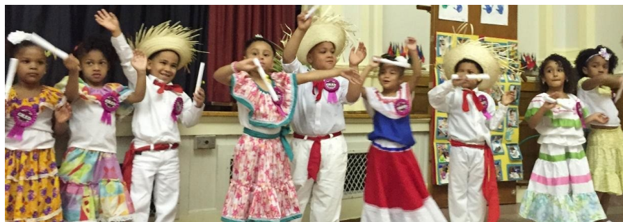
aprendiendo juntos. . . learning together