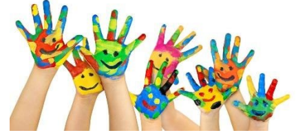
la creatividad creativity