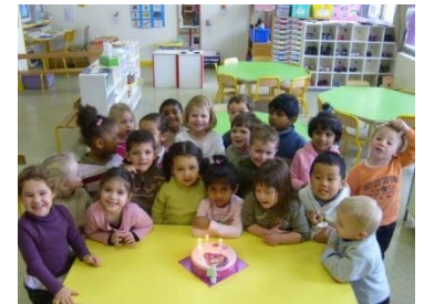
las amistades friends