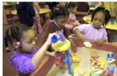
las ciencias science