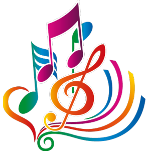
la música music

En MANOS los niños aprenden a través del juego con. . .