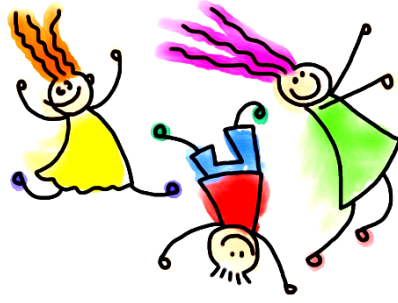
el movimiento movement